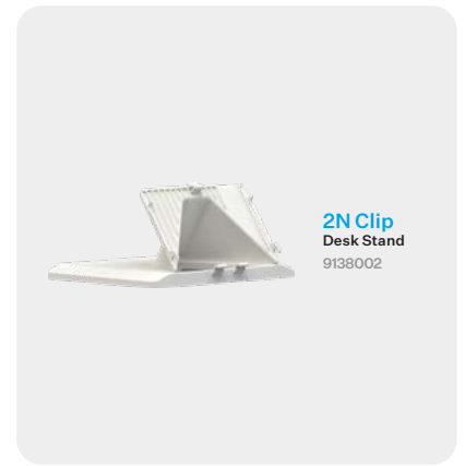
2N Clip Desk Stand 9138002