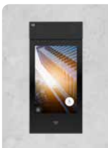
2N® IP STYLE (UNTERSTÜTZTE SECURED KARTEN)