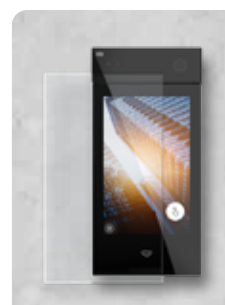
2N® IP STYLE ANTIBAC (UNTERSTÜTZTE SECURED KARTEN)