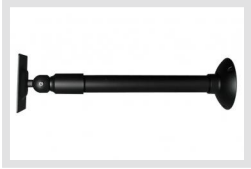
VMC-LCD/WCMB-1 | Artikelnummer: 90394