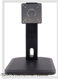
VM-TSH | Artikelnummer: 226566