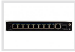
IAD-5SG1008MUA | Artikelnummer: 216472