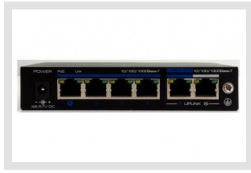
IAD-5SG1004MUA | Artikelnummer: 216469