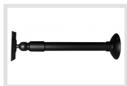
VMC-LCD/WCMB-1 | Artikelnummer: 90394