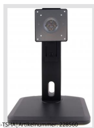
VM-TSHA | Artikelnummer: 226560