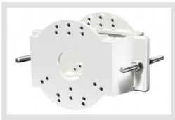
EDC-PM7-W | Artikelnummer: 220492