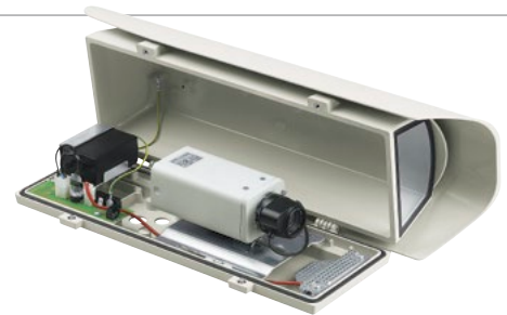
HOV + KAMERA