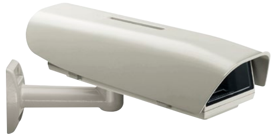
HOV + WBOVA2

Für die unterschiedlichen Anforderungen in verschiedenen Einsatzbereiche stehen zahlreiche Optionen wie Heizung, Lüftung und Filter, sowie Kamera-Netzteile und Scheibenwischer zur Verfügung.